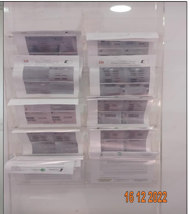
EDICTO R_36157 YC-CRT- 121793