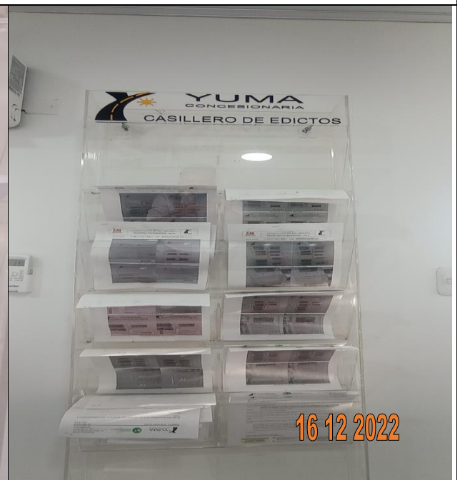
EDICTO R_36157 YC-CRT- 121793